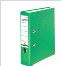
Portfolioordner (DINA4) + 100 Klarsichtfolien